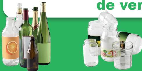
POTS, BOCAUX, BOUTEILLES EN VERRE ET BOUTEILLES DE PARFUM